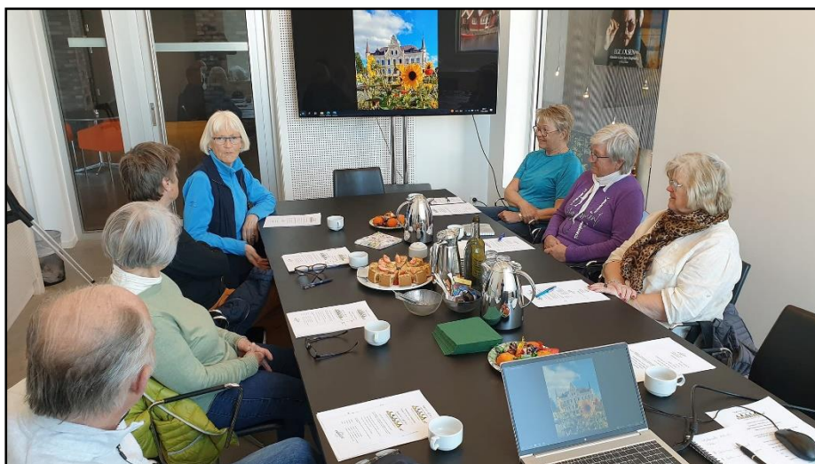
Møte mellom mennesker

I tillegg har leder deltatt i nettverkssamlinger for Frivilligsentralene. Det har også vært prosjektrelaterte møter knyttet til ulike samarbeidsprosjekter.