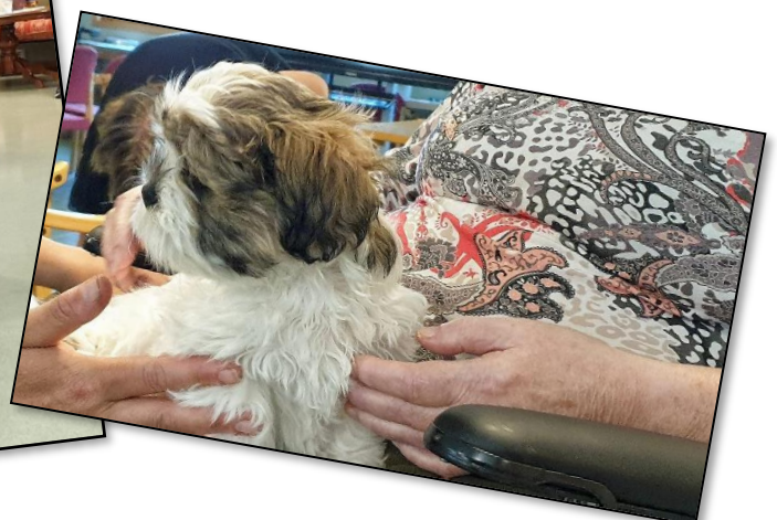
Møte mellom mennesker