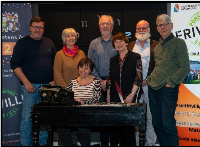
Redaksjonskomiteen i aktivitetstidsskriftet GODT voksen bestående av de frivillige medarbeiderne og leder i Frivilligsentralen.

Porsgrunn Frivilligsentral har hatt ansvaret for sekretærfunksjonen i magasinet Godt VOKSEN. Det har vært avholdt 8 redaksjonsmøter samt en rekke møter redaksjonsmedlemmene imellom gjennom året. Porsgrunn Frivilligsentral har tilrettelagt for arbeids og redaksjonsmøter samt organisert arbeidet i samarbeid med redaksjonsmedlemmene.