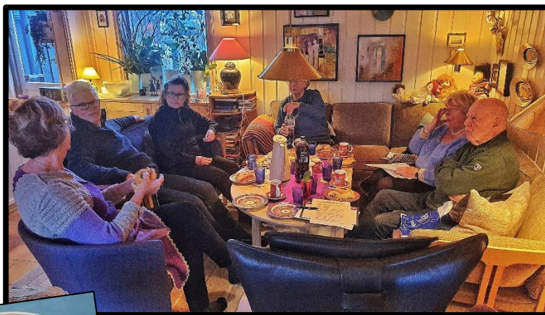
Noen av de frivillige fra de ulike lag og foreninger.

Frivilligsentralen organiserer ulike lag og foreninger i å gi et tilbud til hjemmeboende eldre og institusjonsbeboer i Osebakkenområdet annenhver onsdag gjennom året.